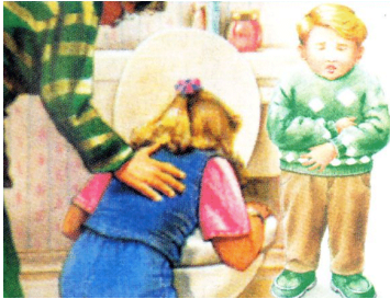
اضطرابات هضمية ومعوية وتقيؤ وإسهال