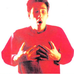
اضطرابات في الجهاز التنفسي