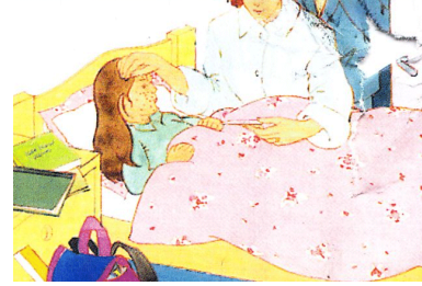
ارتفاع في درجة الحرارة